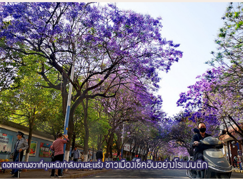
ดอกพลาญชวาที่คุ้มหมื่นท่าสนิมบานสะพรั่ง ชาวเมืองเชียงใหม่อย่างโรแบนติก