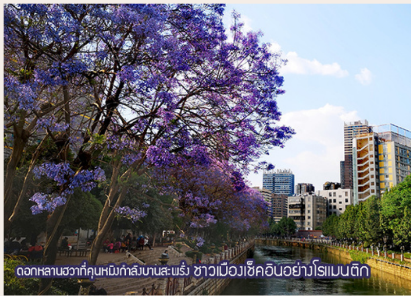
ดอกพลาญชวาที่คุ้มหมื่นท่าสนิมบานสะพรั่ง ชาวเมืองเชียงใหม่อย่างโรแบนติก